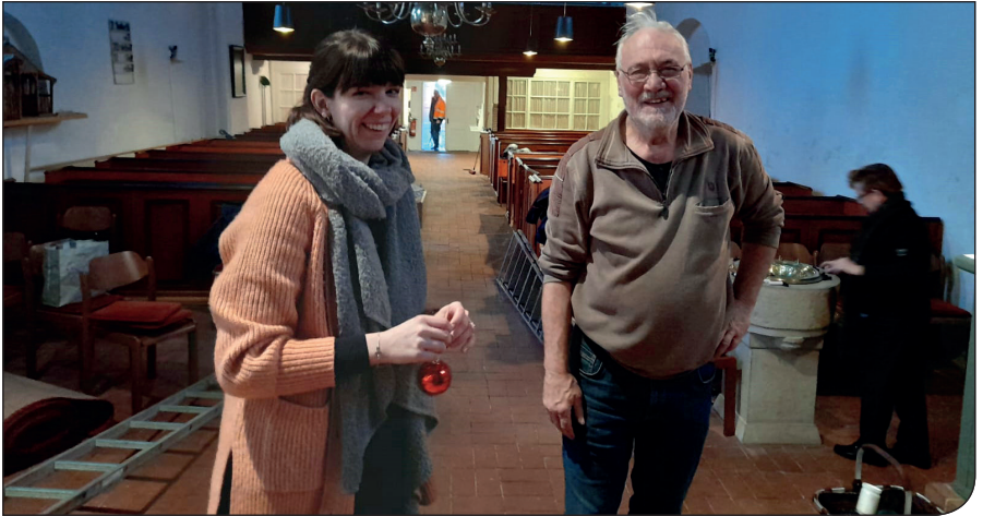
Der KV schmückte wieder die Kirche