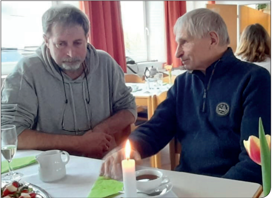
... oder im Zweiergespräch.