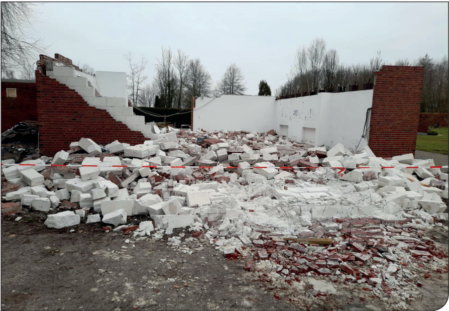
...bis am Ende auch die Giebel fielen.