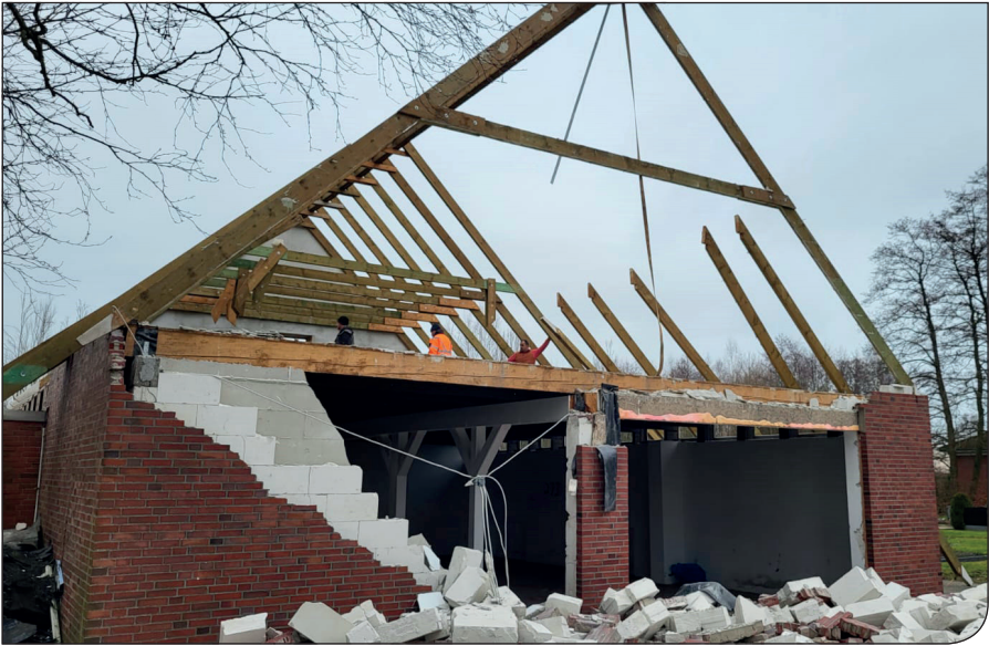
... dann der Dachstuhl...