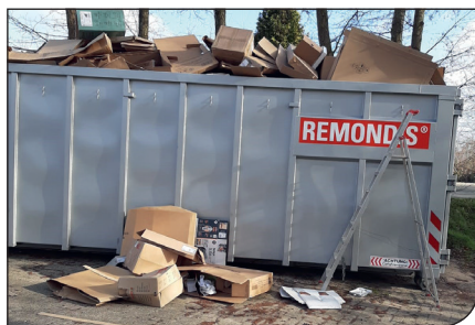
...und in Westerholt