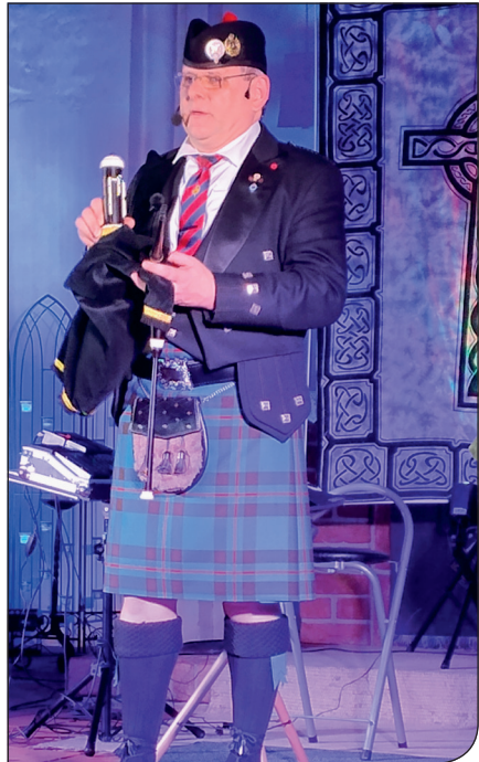
Im März gastierte „Freddy the Piper“ mit verschiedenen Dudelsäcken und einer Handpan. Die zahlreichen Besucher erlebten einen kurzweiligen und stimmungsvollen Abend.