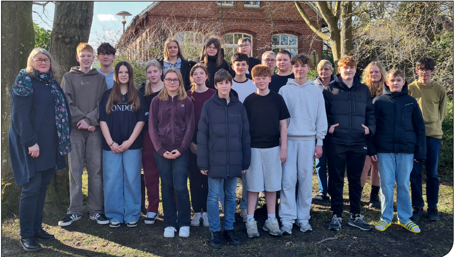
Die Freizeit in Asel war wie immer ein Highlight im Konfijahrgang. Wir waren sehr beeindruckt, wie sich die Jugendlichen auf das Thema Gewalt und Versöhnung eingelassen haben. Der Spaß ist natürlich auch nicht zu kurz gekommen.