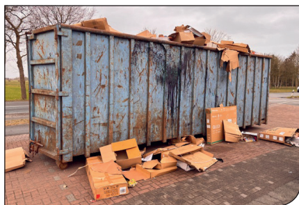
Papiercontainer in Eversmeer...

Beschwerden von Anwohnern wegen umherwehenden Papiers. Zudem wurde der Container in Eversmeer mehrfach unerlaubt umgestellt, so dass die Abholung durch die zuständige Firma teilweise erst nach mehreren Anläufen möglich war.