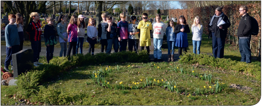
Kurz vor Ostern zeigten sich die ersten Osterglocken in dem Herz, das die KU 4 Kinder beim Tag des Friedhofs aus Blumenzwiebeln gepflanzt hatten.