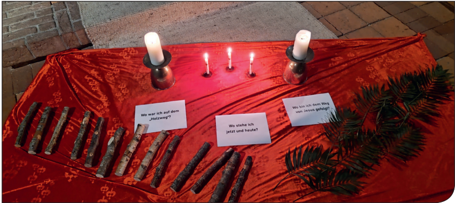
In den sieben Wochen der Passionszeit trafen wir uns im Raum der Stille.