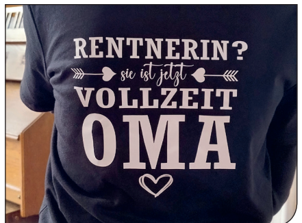
Für ihre Zeit als Rentnerin haben ihre Enkel schon feste Pläne...