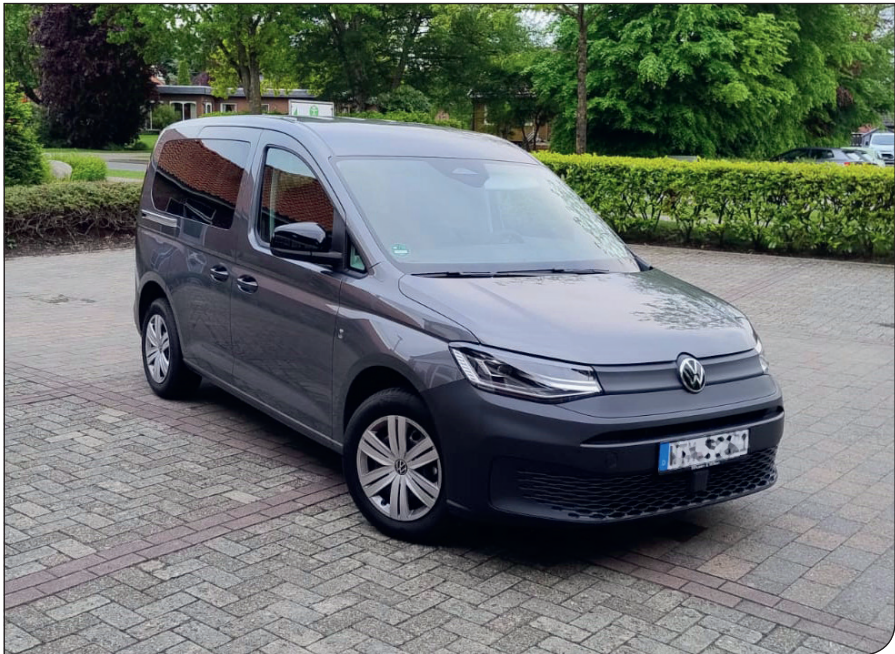
Unser neues Gemeindefahrzeug