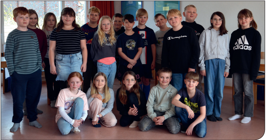
So sehen Sieger aus - die KU 4- Kinder in unserer Gemeinde! Unter diesem Motto gestalteten die Kinder auch den Gottesdienst am Himmelfahrtstag.